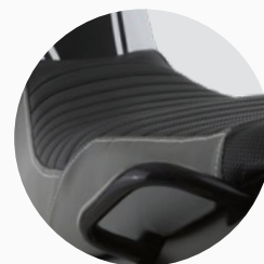
Nuevo asiento con material antideslizante.