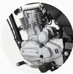
Probado motor de 150cc.

Tapa de combustible tipo flat. Nuevos distintivos y calcos.