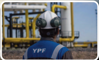
YPF OFICIALIZA EL PROYECTO "ANDES"