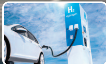
MEJORAS EN COMBUSTIBLES SUSTENTABLES