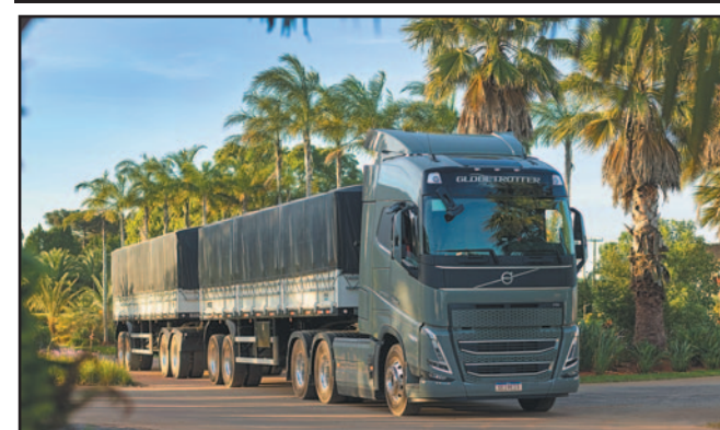
Volvo logra cuatro primeros lugares en los Lotus Award Pág. 98