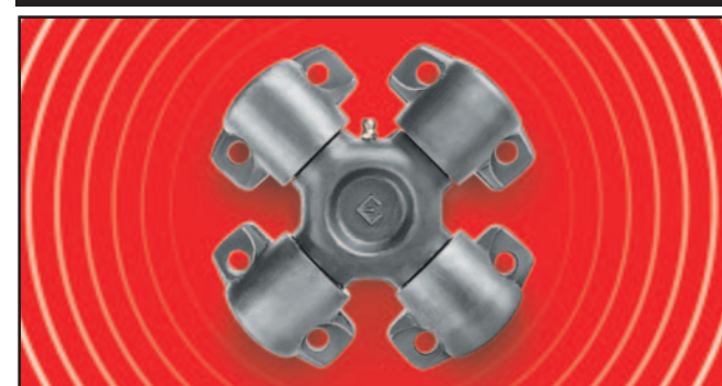
¿Porqué son importantes los tratamientos térmicos Pág. 99