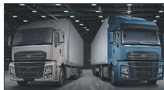
Ford Trucks presenta su gama F-Line en Europa Pág. 97