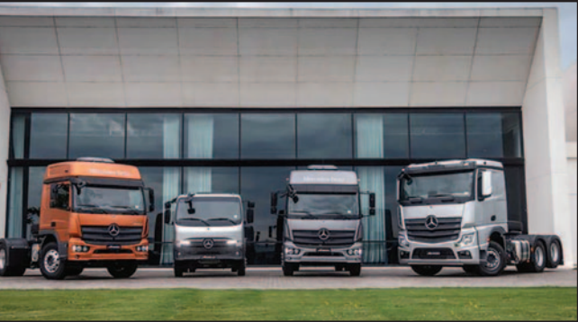
MERCEDES-BENZ ALCANZA ALTOS RESULTADOS EN 2025