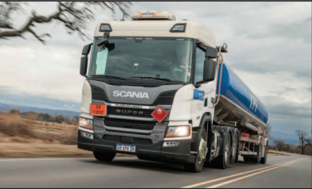
COSTOS DEL TRANSPORTE DE CARGAS SUBEN 37% EN 2025