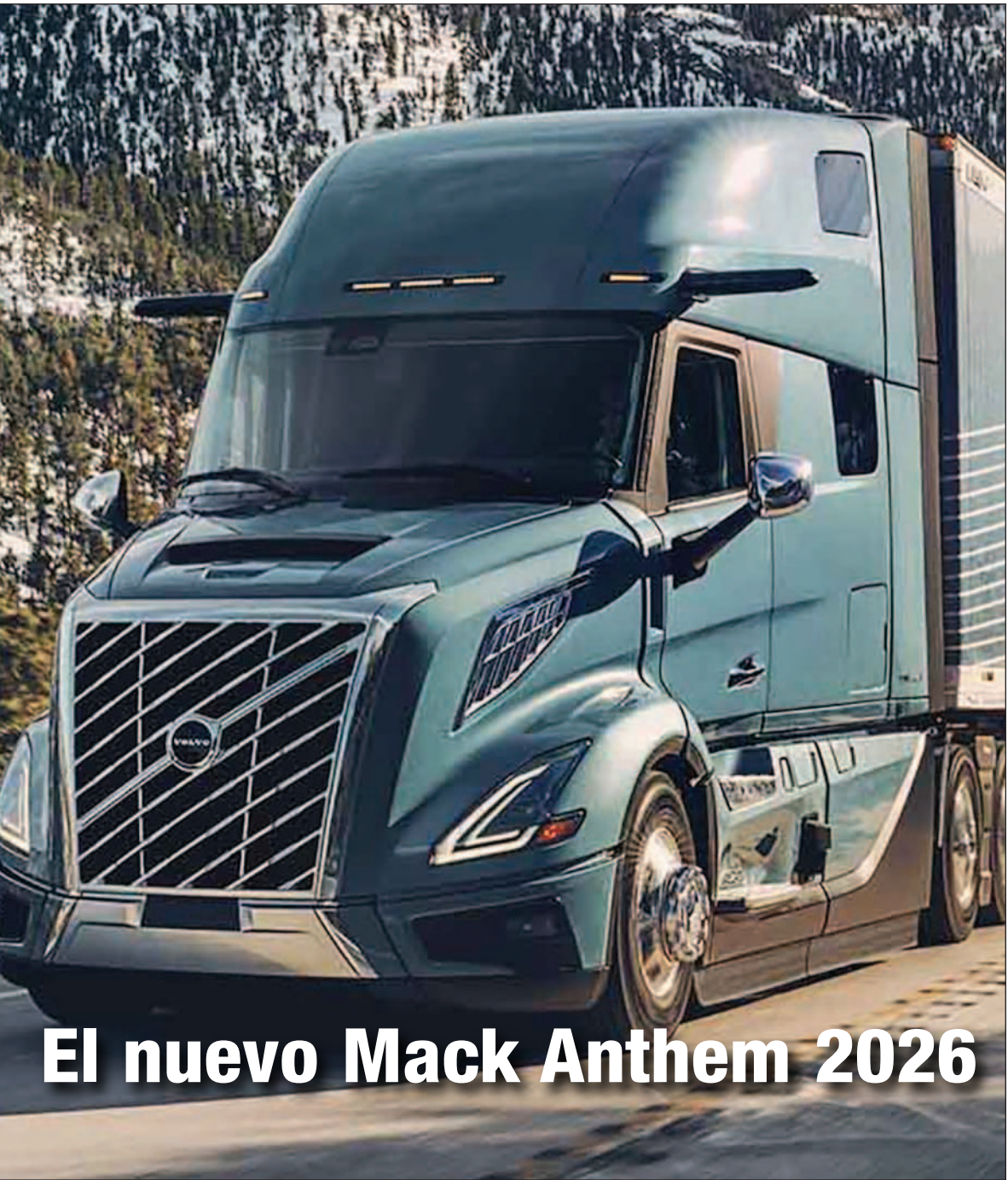
El nuevo Mack Anthem 2026

Reparación y Servicios del Automotor • Año 18 • N° 191 • EDICION NACIONAL -