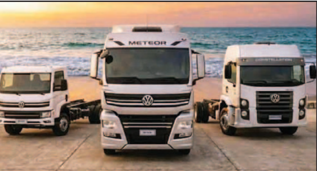
VOLKSWAGEN CAMIONES Y BUSES EN EXTRAVERANO 26